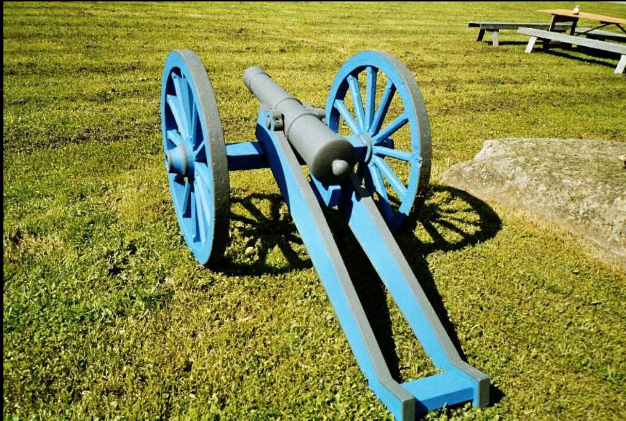
Kuva 9. Suomen sodan aikaisen näköistykki Oravaisista, Vänrikki Stoolin keskus.